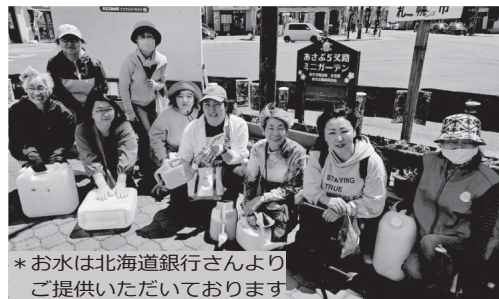
*お水は北海道銀行さんよりご提供いただいております

今年の「あさぶ5又路ミニガーデン」はあさぶ商店街女性部と亜麻保存会の共同で5月15日に設置しました。新しいお花ボランティアさんも加わ