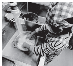
ザッザツとお米とぎ

あさぶ商店街が運営に参画する麻生キッチンりあんで食育にも取り組んできました。今回は「お店のメニューを作ろう」と昨年11月30日、旬の食材や栄養のことを学び、参加した子どもたちで献立を決定。1月8日、「ホタテ貝と冬野菜のクリー