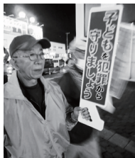
4年ぶりの防犯パトロールに参加(9/28)