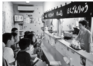
和光小学校3年生の総合学習「麻生のまち探検」(北山龍9/6)