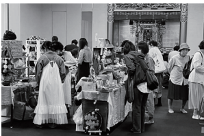
大広間でも手作り販売等