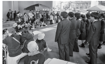
北陽中学合唱部のステキな歌声