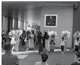
ダンスの最後はマンボ