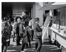
キッチンカーも人気

10月8日、覚王寺を会場に、麻生キッチンりあん、麻生商店街振興組合共催のマルシェを開催。商店街加盟店をはじめ28店舗が出店。1,200人の来場があり、にぎやかな一日となりました。