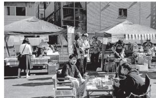
中庭でも食べたり飲んだり