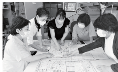
地図の確認など作業中(商店街事務所にて)

あさぶ商店街女性部は、商店街の活性化および麻生地域の安心のまちづくりに向け活動をすすめています。防災・災害対策関連事業として、麻生連合町内会、麻生まちづくり協議会の防災担当の方々と一緒に話し合いを重ね、「麻生地区」防災マップづくりに取り組んでいます。各町内会の防災倉庫や病院、コンビニ調べなど、町内会の皆さまにもご協力いただき完成予定です。完成後は、災害緊急