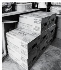
非常時用の飲料水が届きました(11月9日)

商店街駐車場に設置してある災害備品倉庫内には発電機や毛布などの備品を収納しております。昨年より商店街女性部が中心となり倉庫の収納品の見直しをすすめておりますが、駐車場の自動販売機を災害対応型にできないかとの意見が出ました。そこで、自販機の設置会社である北海道キリンビバレッジサービス(株)に相談したところ、施設外にそうした自販機を設置することは難しいが、災害時に備えての飲料