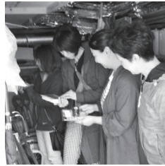
女性の視点で点検

昨年9月の胆振東部地震から1年が過ぎましたが、今年は先の台風15号に続き19号の被害が甚大です。被災されました皆さまへのお見舞いとともにお祈り申し上げます。 あさぶ商店街においては2012年に災害備品庫を設置しておりますが、10月9日、女