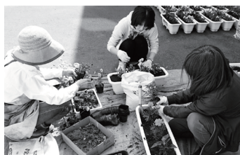
今年もお花ボランティアさんといっしょに花を植えました