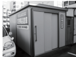
寒冷地仕様の備品倉庫、商店街駐車場内に設置

2011年3月11日東北地方を襲った「東日本大震災」の惨状は、交通の要衝に位置する商店街の役割を改めて問い直すきっかけとなりました。災害備品倉庫は、麻生にお住まいの方のみならず、通勤通学や商店街利用の方が麻生を訪ねたときに