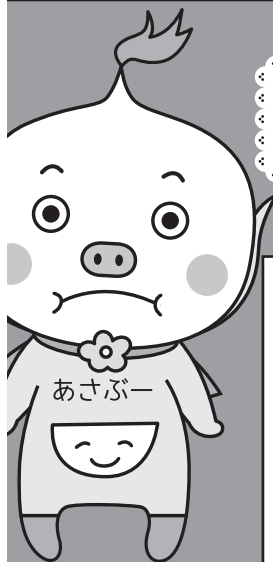
あさぶ商店街 キャラクター「あさぶー」

北区麻生町 6丁目 14-6 TEL: 011-707-9923 FAX: 011-758-7345