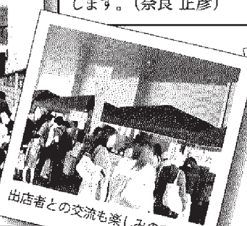
出店者との交流も楽しみのひとつ。

札幌市事業廃棄物課と連携して、ごみステーションなどの巡回をいたします。みなさんのご協力をお願いいたします。(奈良 正彦)