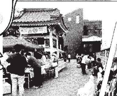
あさぶおすそわけマーケット 通路にも椅子があり、のんびり～