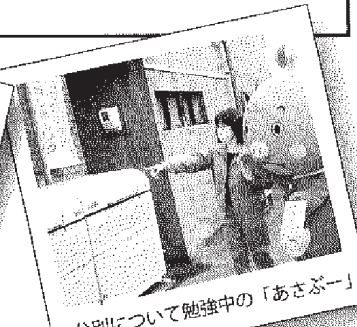
分別について勉強中の「あさぶー」